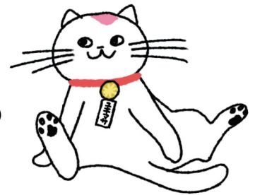
日本行政書士会連合会公式キャラクター ユキマサくん

申込： ひのきお行政書士事務所ホームページより https://hinokio.jp